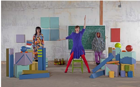
Emily Mast, B!RDBRA!N (Addendum) , 2012, video installation Collection FRAC Languedoc-Roussillon