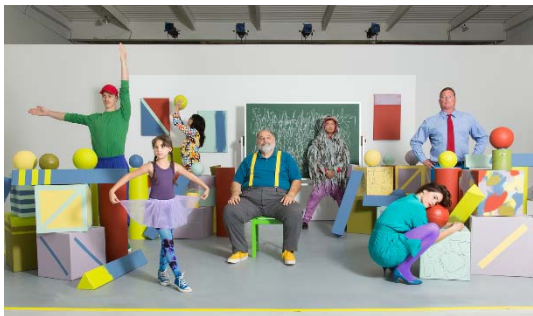
Emily Mast, B!RDBRA!N (Addendum) , 2012, video installation Collection FRAC Languedoc-Roussillon