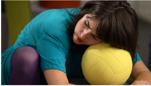
Emily Mast, B!RDBRA!N (Addendum) , 2012, video installation Collection FRAC Languedoc-Roussillon